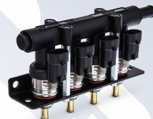
Barracuda LPG/CNG Injector